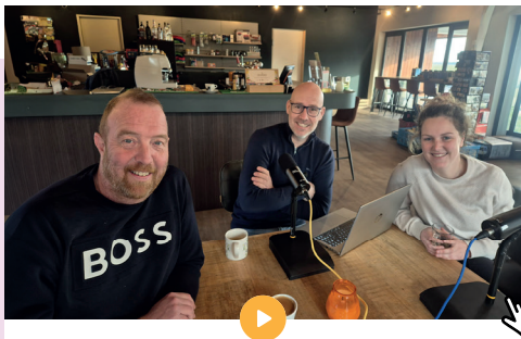
Aan tafel geweest met Camping De Bosrand

Beluister ook de podcastopnames, gemaakt voor en door Drentse recreatieondernemers: