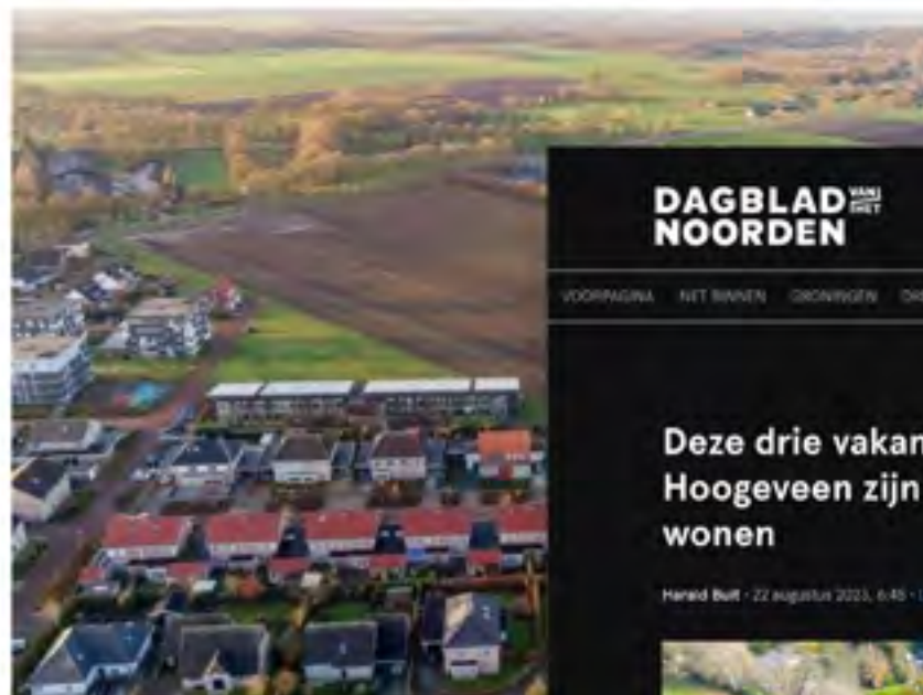
Vakantiepark Mooi Oavelt