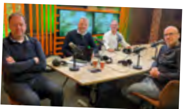
Aflevering 4 Bedrijfsopvolging binnen de familie