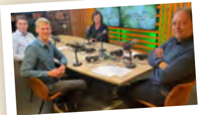
Aflevering 6 Revitaliseren