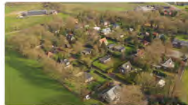
Vakantiepark Nieuwlande in Wapse

De aanmeldingen van vakantieparken die willen excelleren stromen binnen bij het Programma Vitale Recreatieparken. Tegelijkertijd zit de snelheid er niet in bij het aanpakken van parken die geen toekomst hebben als recreatief park.