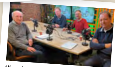
Aflevering 7 Transformatie: Draagvlak en mandaat