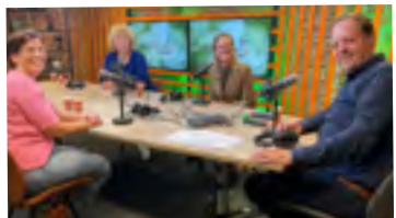
Aflevering 3 Arbeidsmigranten op vakantieparken