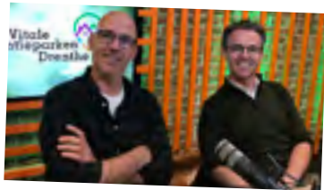
Aflevering 2 Impact overnames