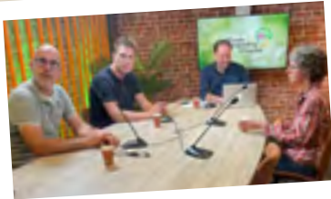
Aflevering 1 Stikstof